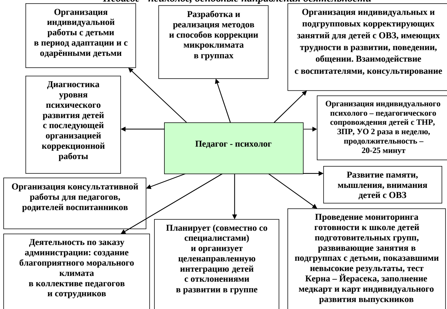
Рис. 2 «Педагог - психолог, основные направления деятельности»