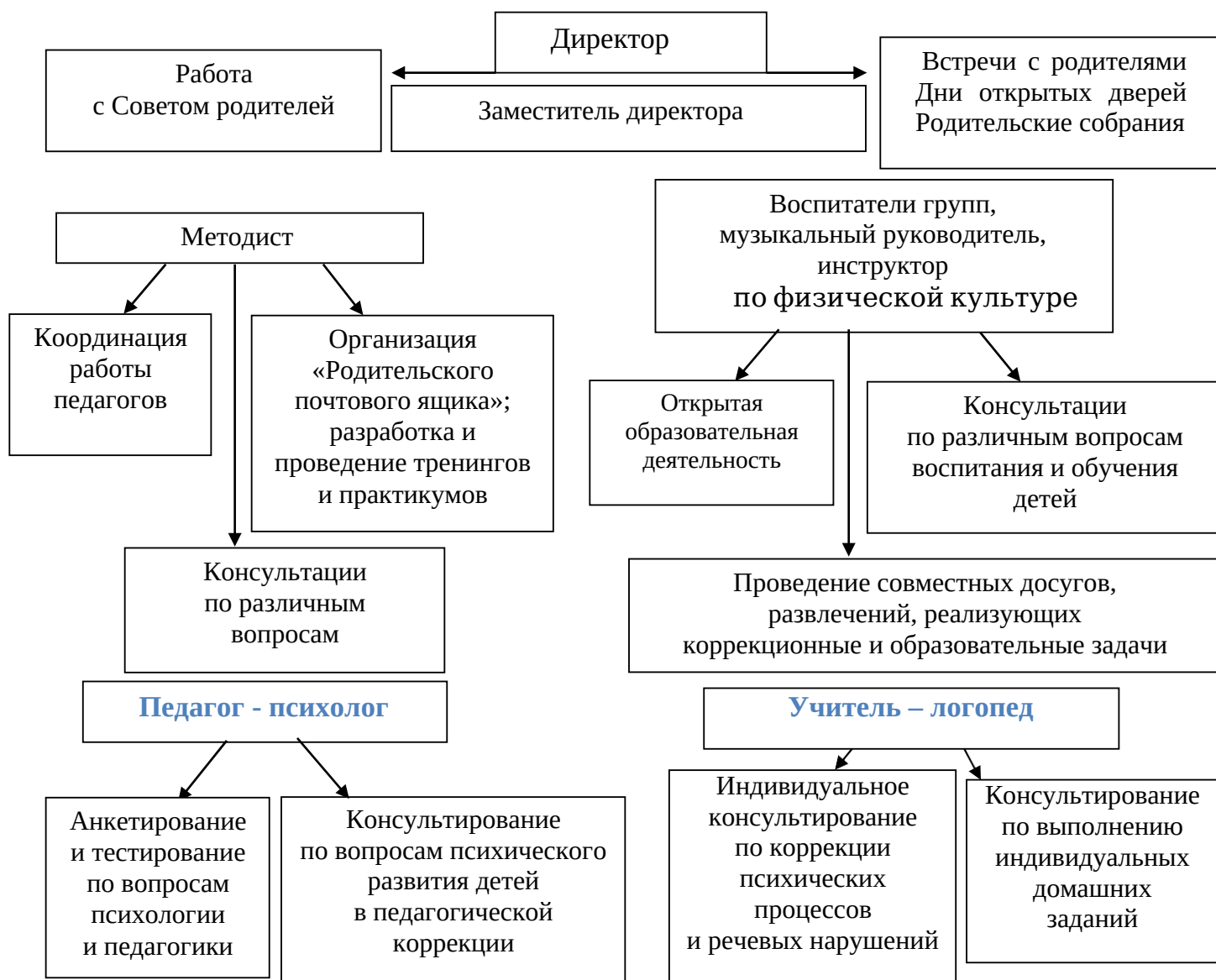
Рис. 1 «Схема взаимодействия с семьями воспитанников»